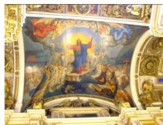
пись Исаакиевского собора