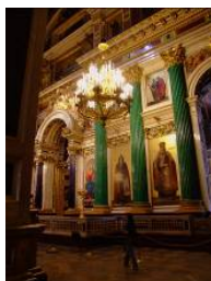
Внутренний вид собора